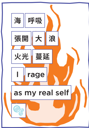
結合不同語言，並加上裝飾